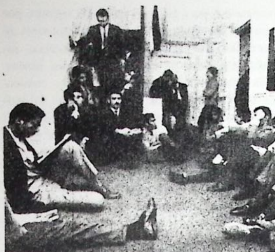
¿A mayor educación, más empleo?

quiere decir que la gente volverá al trabajo cuando este lo suficientemente hambrienta para aceptar un salario bajo). Se consideró que la sobreeducación, había originado el que la gente se colocara un precio fuera del mercado. Elevando el costo de la educación hasta su verdadero valor en el mercado, se resolvería el problema. Algunos van hasta a afirmar que la investigación ha mostrado que la educación produce poco valor agregado.