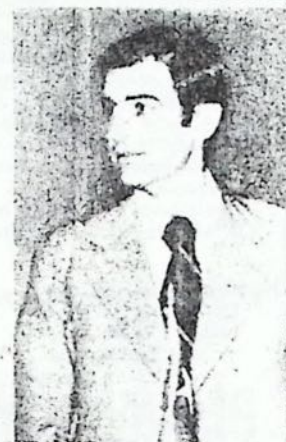
SERGIO FERNANDEZ, Ministro del Trabajo y Previsión Social viajó a Concepción.