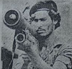
Un contra entrenando con el SAM-7 en Honduras: Escalada terrorista.

Nicaragua enfrenta por esa guerra. El imperialismo mantiene latente la amenaza de la intervención armada; si lo considera necesario y oportuno no vacilará en llevarlo a cabo; de paso obliga al Gobierno Sandinista a un tremendo esfuerzo de defensa; provoca y controla el bloque financiero en la banca internacional; planea, financia y lleva a cabo actos de sabotaje dentro del país; entrega a los enemigos de la revolución toda la información de inteligencia que su red de espionaje le proporcio