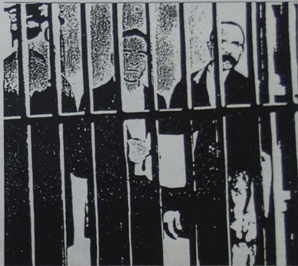
La larga agonía de Sacco y Vanzetti tras las rejas se convirtió, para el mundo, en símbolo de injusticia y de la ceguera de una época

Vanzetti, piemontés, de ojos fríos e inteligente, enormes bigotes, aficionado a la lectura, intentó muchos trabajos antes de terminar en una pescadería de Plymouth. Sus ideas políticas, socialistas en su adolescencia las continuó posteriormente en E.U. Nicola Sacco, en cambio, era un pacífico padre de familia, con voz suave y melancólica del hombre del sur. Trabajaba como zapatero en South Stoughton, cerca de Boston, y llevaba una vida tan ordenada que sus amigos se burlaban cariñosamente de él.