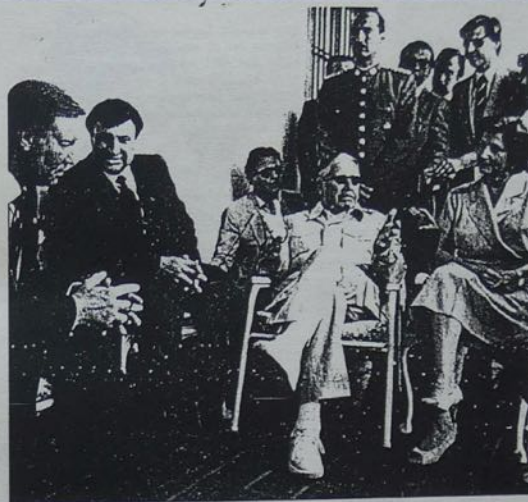
Jimmy Swaggart y Pinochet

parece pagando una suma superior a los $100 mil dolares a su secretaria, suma muy elevada para ser considerada parte de sus honorarios.