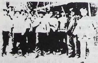
Sin embargo, no todo es negro en

Este conjunto de factores ha tenido un impacto brutal también en las capas medias. La política económica ha proletarizado a un sector mayoritario de su contingente o lo ha empujado al exilio económico. Pero sería poco realista derivar de estos hechos reales y dramáticos la conclusión de que estas capas medias, por la simple pérdida de sus posiciones económicas y sociales, son ya aliados de las fuerzas de izquierda. Hay que tener presente que es sobre ellas que opera con mayor fuerza y eficacia la guerra psicológica y la deformación ideológica por vía de los medios de comunicación, presentándole engañosamente y de mala fe valores como los de orden, paz y tranquilidad. Con la misma fuerza operan los alicientes para el consumismo y la ilusión de una riqueza material que ni siquiera las capas medias de algunos de los más ricos países desarrollados poseen.